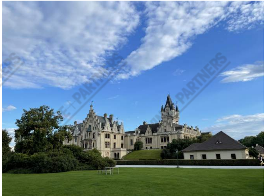
Dvorac Grafenegg u kojem se održava Austrian Single Vineyard Summit