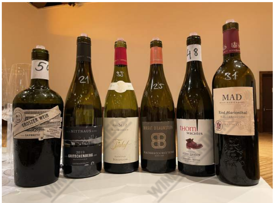
Najbolja crna vina s kušanja

Jednom godišnje udruženje vinara ÖTW (Österreichische Traditionsweingüter) u dvorcu Grafenegg iznad Beča organizira Austrian Single Vineyard Summit, manifestaciju na kojoj se tržištu i medijima predstavljaju isključivo Riedenwein, dakle single vineyard vina s najvišim lokalnim oznakama porijekla i kvalitete (doduše, u različitim podregijama postoje različite podjele i nazivi), kao što su Erste Lage, Grosse Lage ili Smaragd.