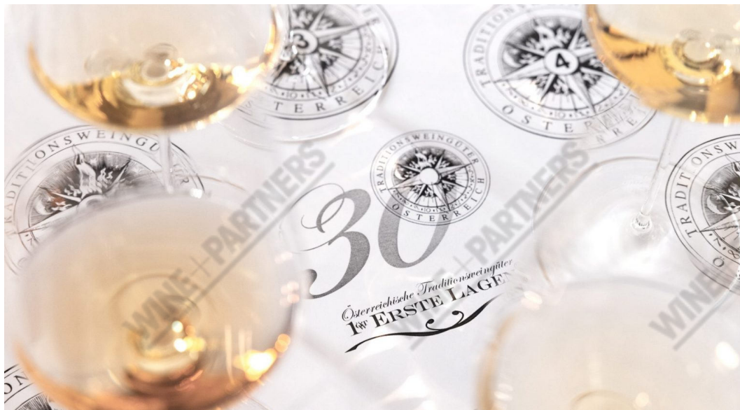
ÖTW feiret i år 30 år som forening.

Det dyrkes 36 druesorter i Østerrike, 22 hvite og 14 røde, som er godkjent for produksjon av Qualitätswein (kvalitetsvin) eller Qualitätswein med spesiell modenhet og type høst (Prädikatswein – søt vin) og Landwein. Andelen røde viner har doblet seg de ti siste årene og representerer nå en tredjedel av Østerrikes vingårder, totalt 46 000 hektar. Østerrikes mest kjente drue er Grüner Veltliner som står for omtrent en tredjedel av produksjonen med Riesling på en god andreplass. Andre druer som dyrkes er: Pinot Blanc, Chardonnay, Muskateller, Traminer, Neuburger, Rotgipfler, Zierfandler, Roter Veltliner, samt de røde variantene: Pinot Noir, Merlot, Cabernet Sauvignon, Syrah, Zweigelt, Blaufränkisch, St. Laurent og Blauer Wildbacher.