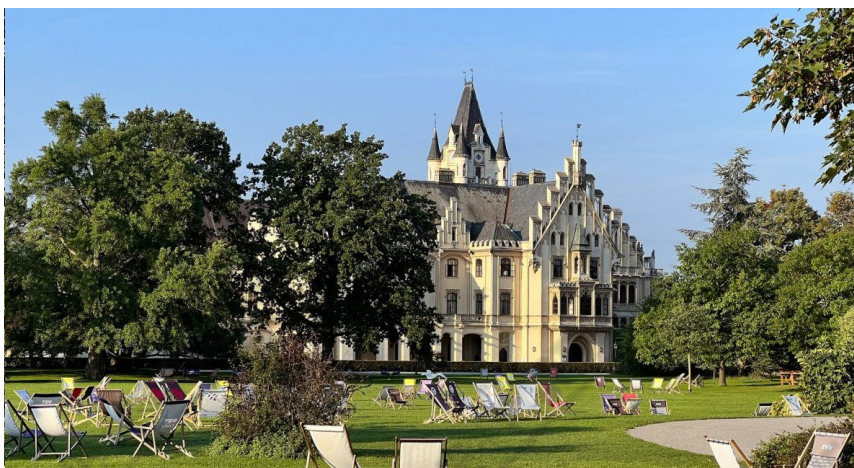
Vakre Schloss Grafenegg.

🕒 23. september 2022 ✍️ Jørn G. Broll, matogvinnett.no