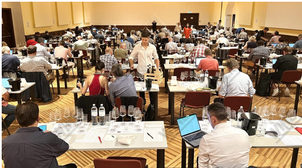
300 journalister, sommelierer og innkjøpere samlet seg for å smake Østerrikes Erste Lagen-viner.