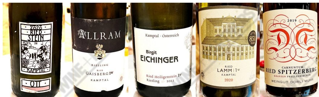
Et utvalg gode viner fra Kamptal og Carnuntum.