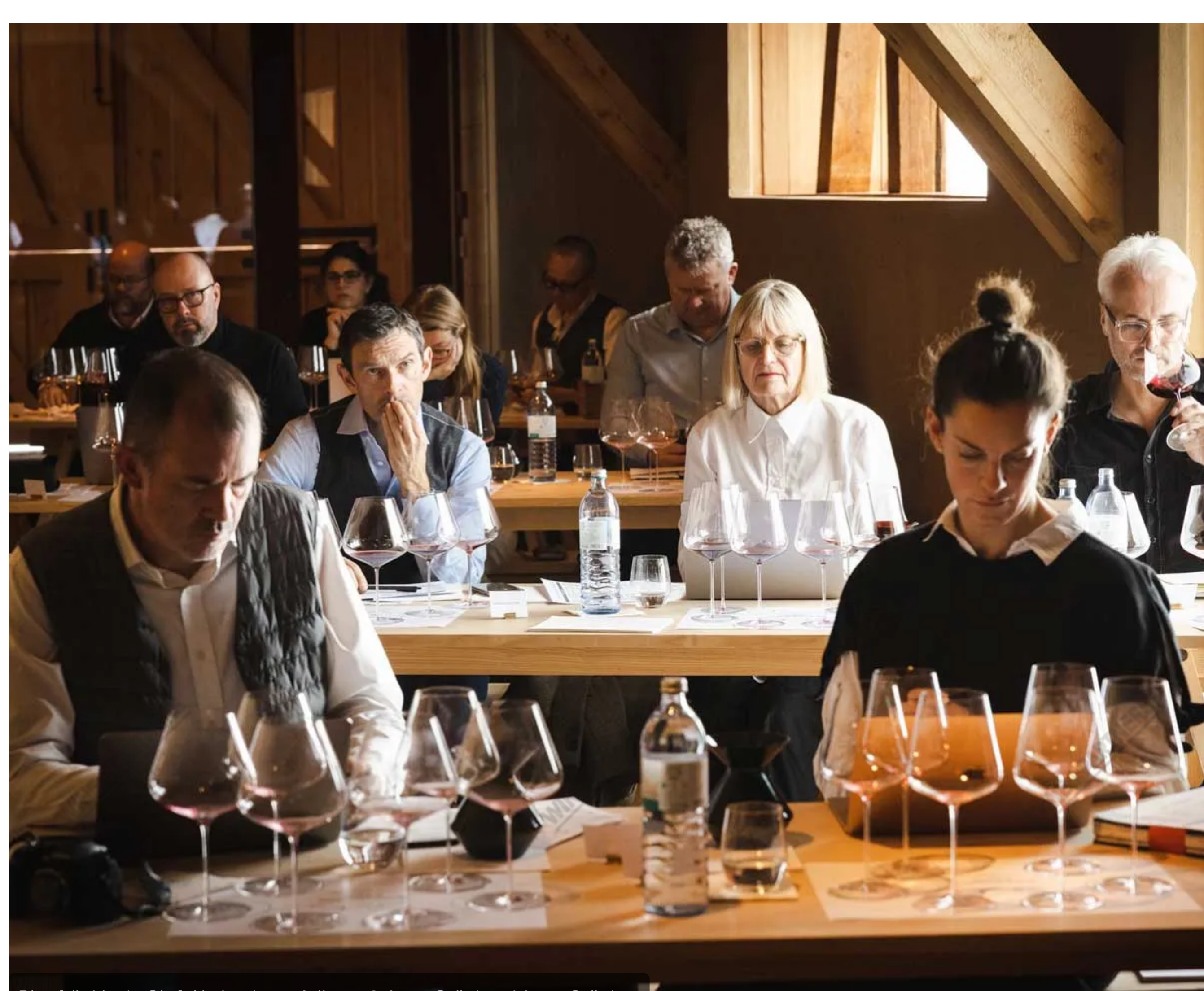
Blafränkisch-Gipfel in Lech am Arlberg

Wie sich im Zuge einer vergangenen Verkostung ( Blafränkisch versus Barolo ) bereits gezeigt hat, trumpft Blafränkisch mit einem enormen Reifepotenzial auf und ist preislich gesehen konkurrenzlos. Ersteres wurde auch bei Lechs Blafränkisch-Gipfel bestätigt: Vom Reifepotenzial über die Reflektion des Terroirs, Komplexität bis hin zur Finesse – Blafränkisch erfüllt sämtliche Parameter, die von einem ausgezeichneten Rotwein erwartet werden.