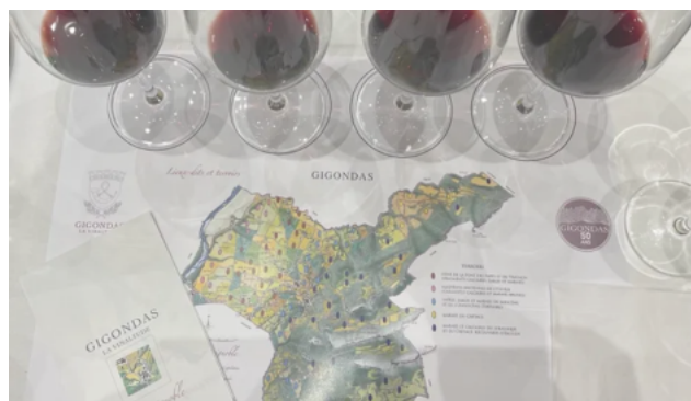
Gigondas feiert 11/12/2021 In "Blog"