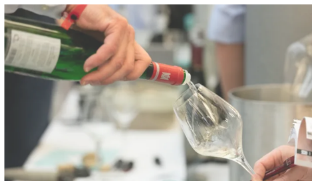
Große Lagen, große Weine 09/02/2017 In "Blog"